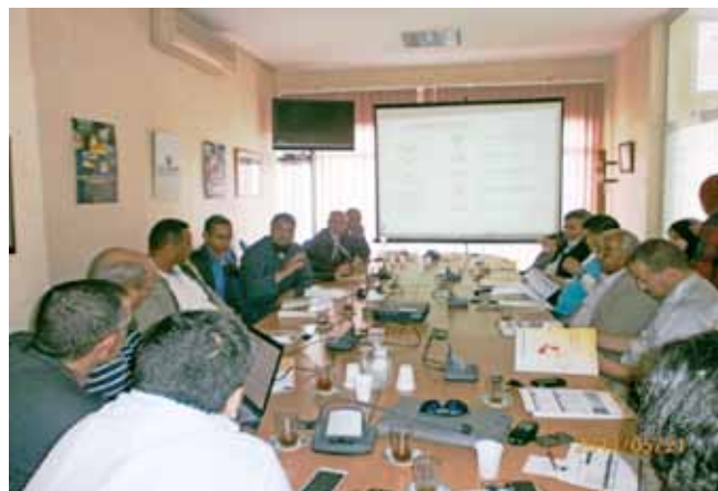
La délégation algérienne en visite à la FISA, le 21/05/2013

d'instaurer des liens de partenariat et de collaboration avec la FISA.