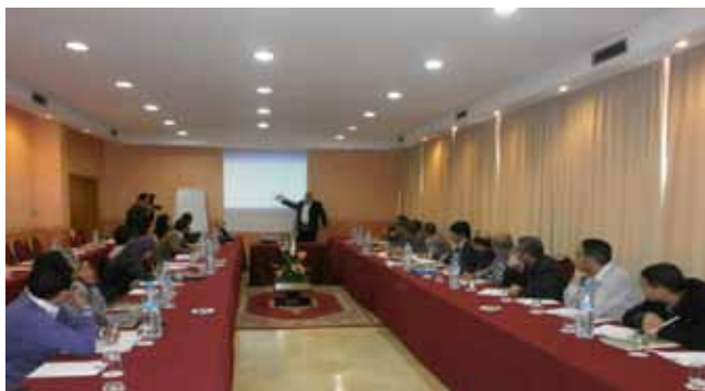
Séminaire de l'AFAC sur la loi 28-07, le 15/05/2013 à Casablanca

Dans le souci de sensibiliser et de clarifier aux providiers les dispositions législatives et réglementaires relatives au secteur de l'alimentation animale, les bonnes pratiques de production et le contrôle sanitaire des aliments composés, l'Association des Fabricants d'Aliments Composés (AFAC) et l'ONSSA ont organisé, le 15 mai 2013 à Casablanca, un séminaire sur les dispositions de la loi 28-07 et ses textes d'application et leurs implications sur le secteur de l'alimentation animale. Cette session qui a été l'occasion d'un échange interactif entre les animateurs et les participants a été clôturée sur la nécessité de la coopération entre l'ONSSA et les professionnels de la filière de la provende et de l'engagement des uns et des autres pour la bonne application de ladite loi.