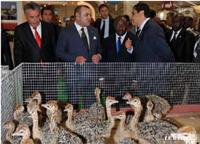
Sa Majesté le Roi Mohamed VI ainsi que son Excellence M. Ali Bongo Président de la République du Gabon en visite au Stand de la FISA au SIAM 2013