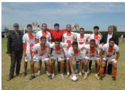
ALIMENTS ET POUSSINS