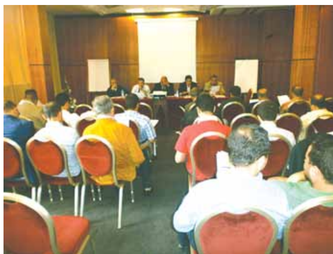
Assemblée Générale Ordinaire de l'ANPO, le 15/06/2013

L'ANPO, l'ANAM et l'AFAC ont également procédé au renouvellement de leurs Conseils d'Administration respectifs.