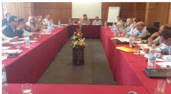
Assemblée Générale Ordinaire de la FISA Le 20/06/2013