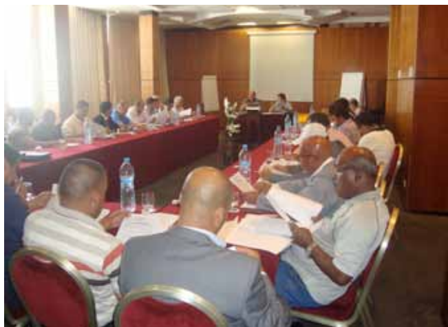
Séminaire de l'APV, les 28 et 29/06/2013.

L'APV a organisé, en collaboration avec la FISA, les 28 et 29 juin 2013 à Casablanca, une session de formation au profit de ses délégués et bureaux régionaux sur le thème: «Rôle et fonctionnement des représentations régionales de l'APV». Cette session de formation, qui a connu la participation de 50 personnes, avait pour objectif d'exposer aux dirigeants régionaux les modes de bon fonctionnement et de gestion des affaires administratives, financières et organisationnelles des représentations régionales de l'APV, ainsi que les mécanismes de coordination et de communication internes et externes. La première journée a été consacrée à la présentation des statuts et des procédures de fonctionnement et de communication de l'Association. La 2 ème journée a été réservée au travail en commissions spécifiques présidées par les dirigeants du bureau national: