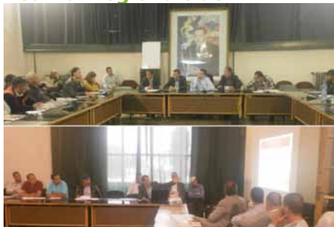
Réunion régionale de l'APV à Meknès, le 26/04/2013

Dans le cadre de son programme d'action au titre de l'année 2012-2013 et du contrat programme Gouvernement - FISA, l'APV a organisé le vendredi 26 avril, en marge du SIAM 2013, à la Chambre d'Agriculture de la région Meknès-Tafilalet, une réunion d'information et de sensibilisation au profit des éleveurs de la région. Cette journée a été animée par les représentants de l'APV qui ont traité les thèmes suivants :