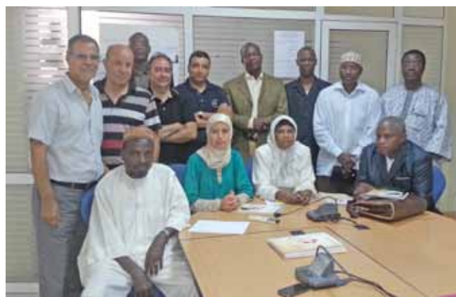
La délégation nigérienne en visite à la FISA, le 10/07/2013