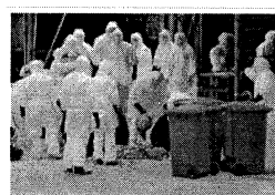
Vidéo: Grippe aviaire : Risques élevés pour une pandémie humaine en Indonésie

Le Salon marocain de l'aviculture s'ouvre dans une conjoncture incertaine